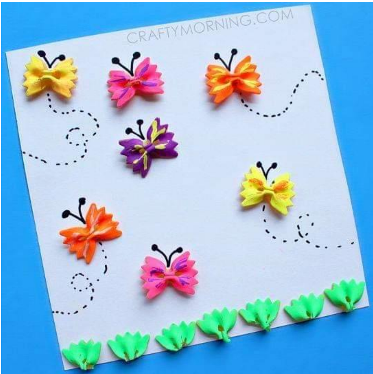
FIARFALLE CON LA PASTA