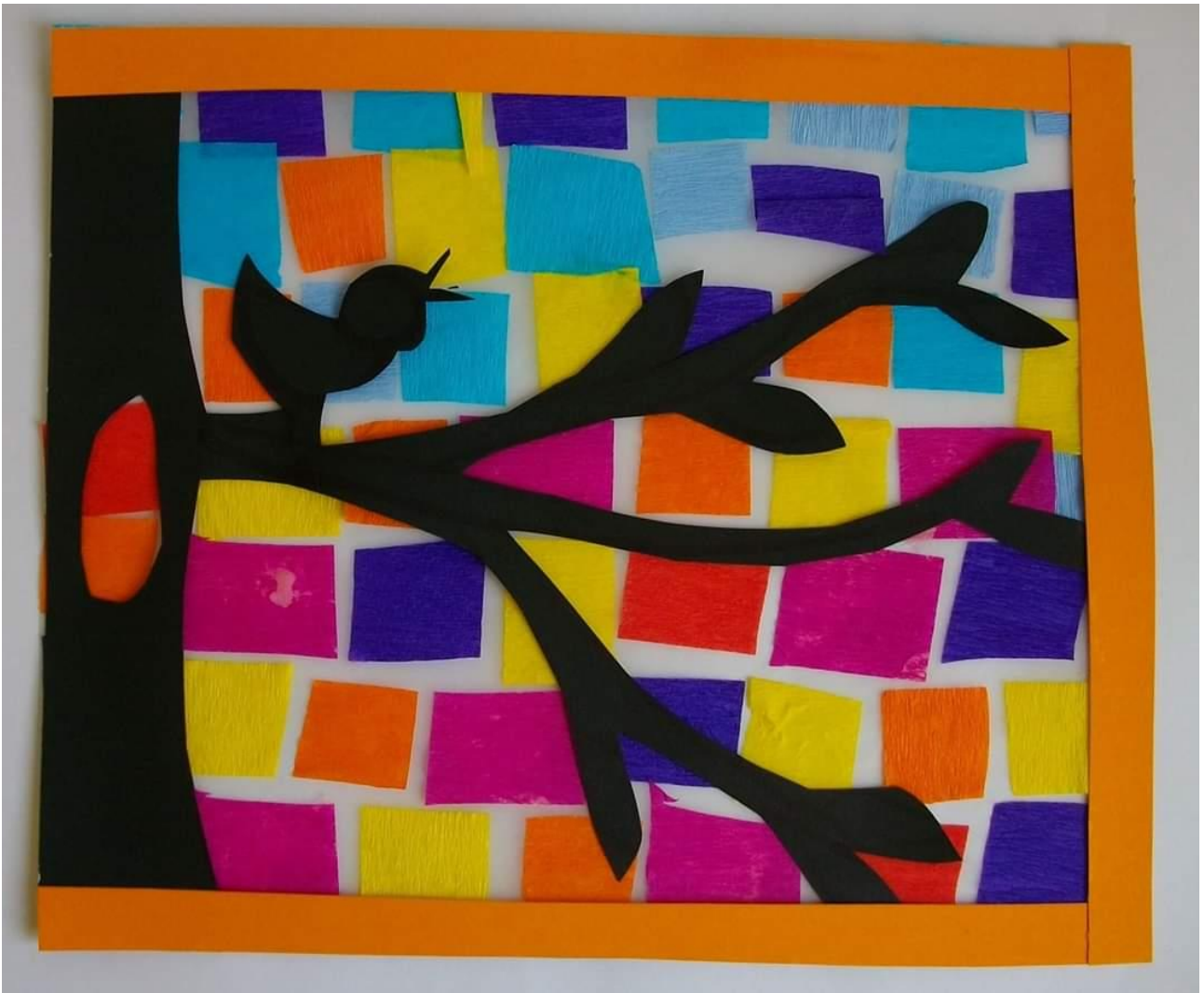
COLLAGE DI PRIMAVERA