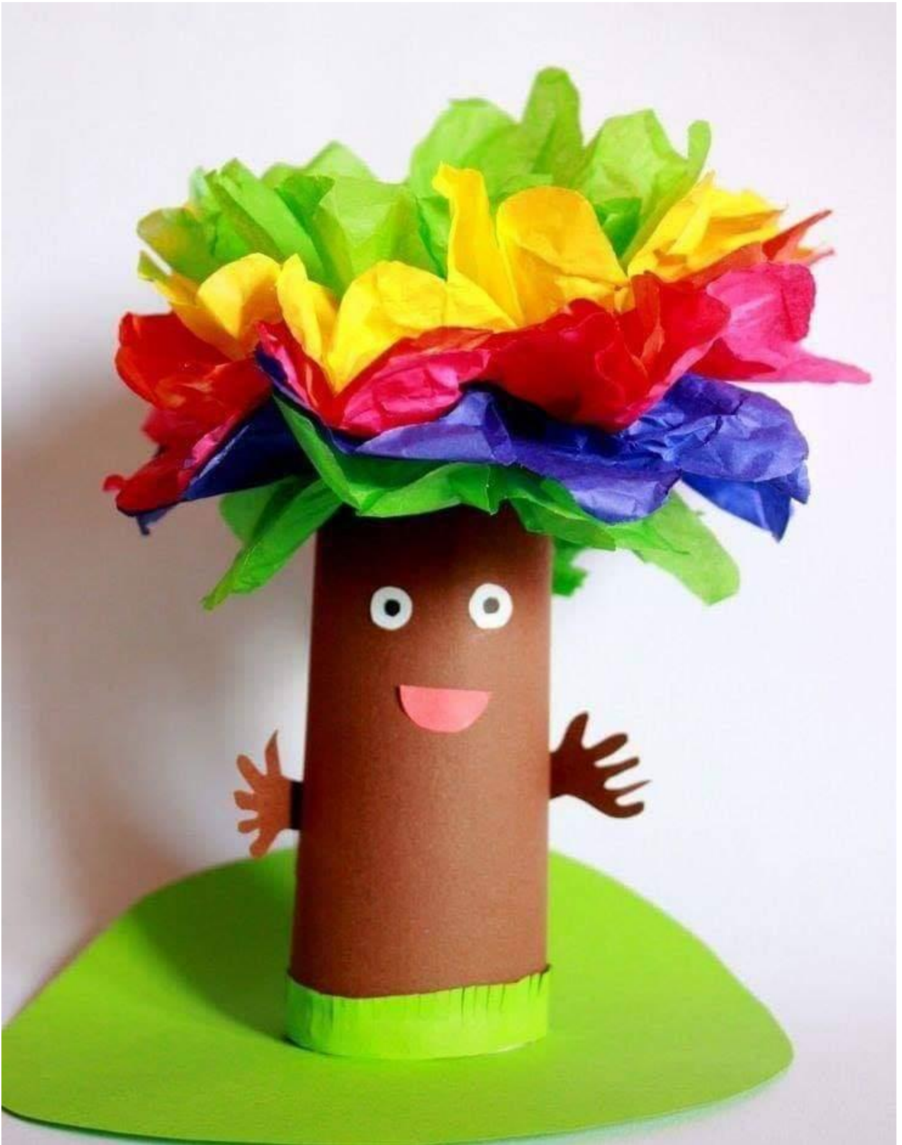
ALBERO DELLA PRIMAVERA