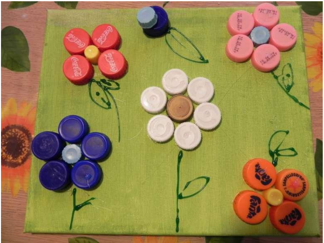
FIORI CON I TAPPI DELLE BOTTIGLIE