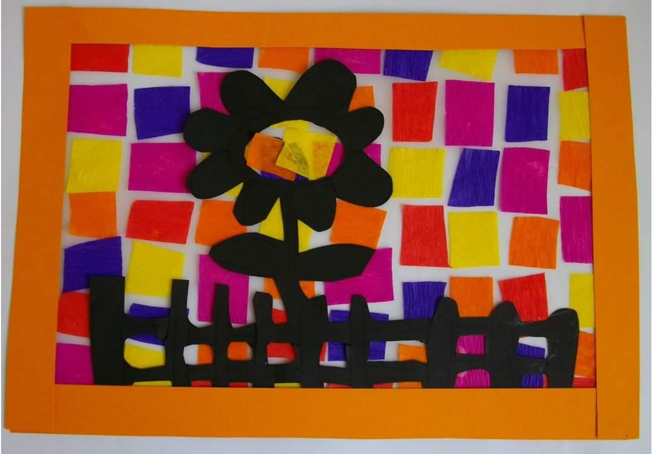
COLLAGE DI PRIMAVERA